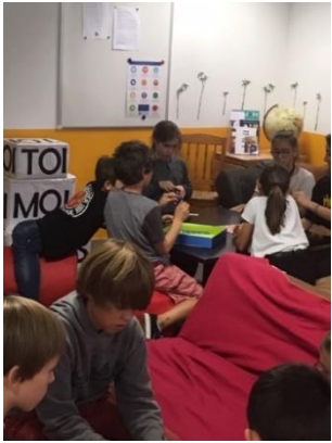
Toussaint fête des amis de Dieu