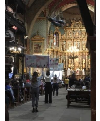
La messe de la St Thomas Dieu parmi nous pour le sacrement de l'eucharistie.