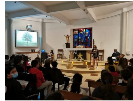
Noël Dieu rejoint notre condition humaine avec la naissance de Jésus