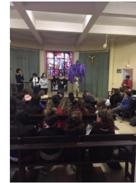
Le temps du Carême et Pâques cœur de la foi chrétienne fête de la résurrection du Christ